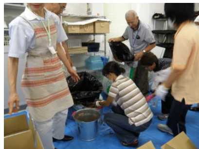
生ごみの堆肥づくり体験