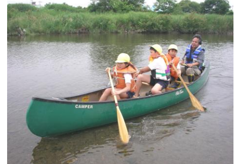
入間川での子供たちのカヌー体験