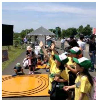
環境フェアに集まる子供たち