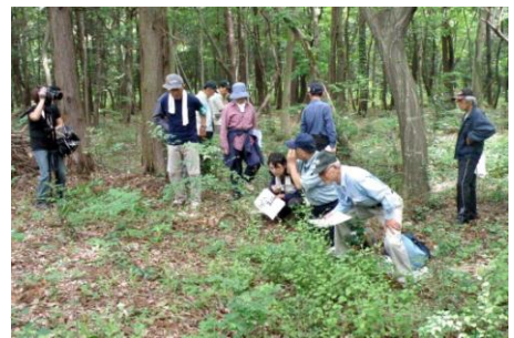
市民による緑のトラスト9号地の管理