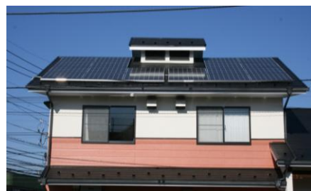
1号機東急入間川自治会館