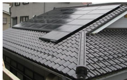
2号機新狭山1,3丁目自治会館