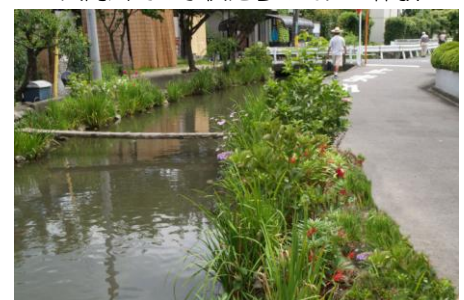
用水路のネットワークも貴重な環境資源