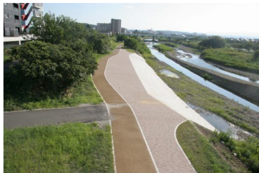
進む入間川の親水スペースづくり