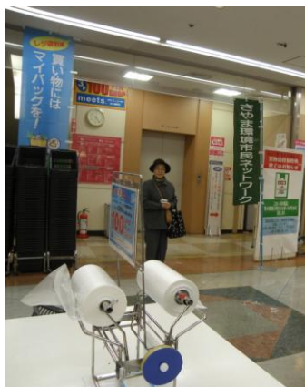
マイバック持参運動の展開