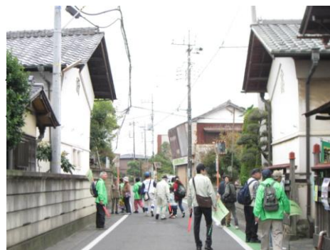
広報「さやか」に連載中の漫画家・砂川しげひさ氏の環境漫画 水富の蔵のある街並みを歩く環境ウォーク 2012