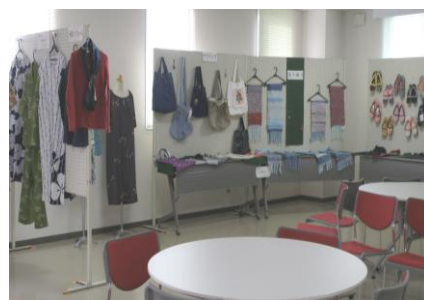
体験教室の作品展