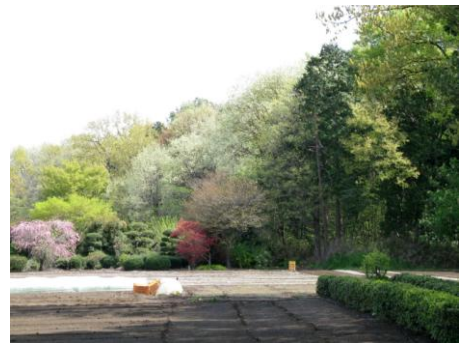
雑木林と田園が織りなすたおやかな里